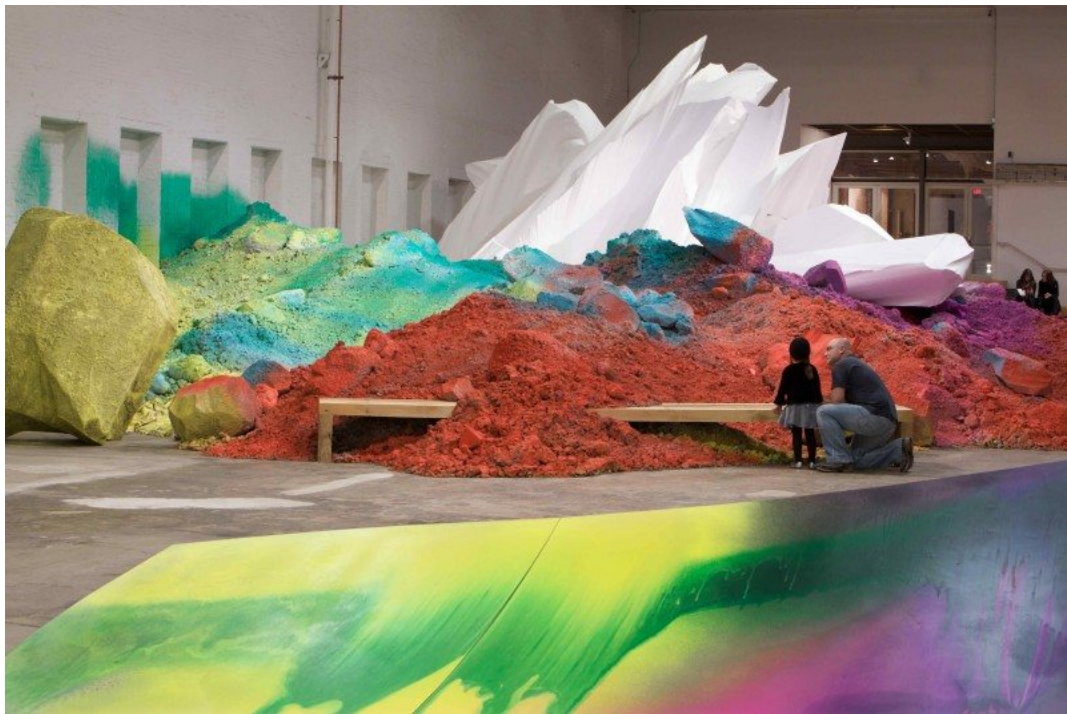
Katharina Grosse: One Floor Up More Highly, 2010