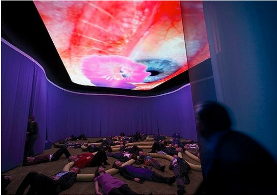
Pipilotti Rist: Homo Sapiens Sapiens, 2005