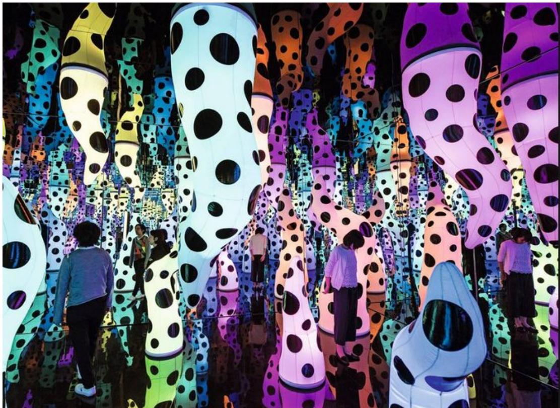
Yayoi Kusama: Love is Calling, 2013