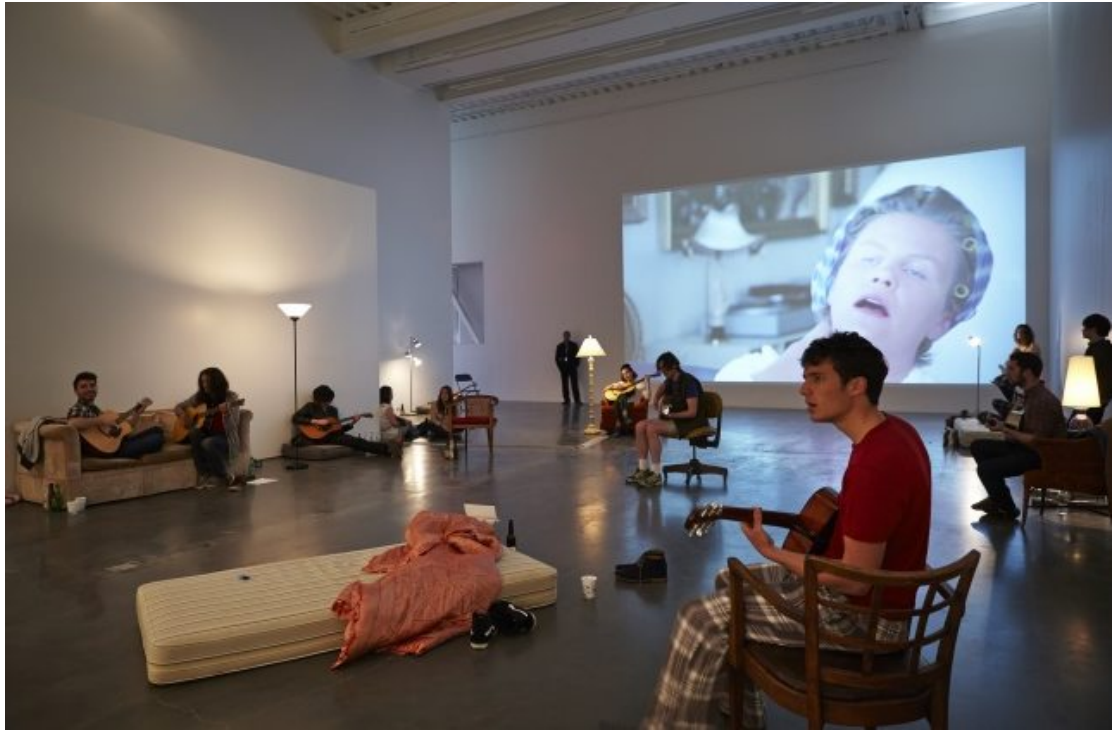
Ragnar Kjartansson: Me, My Mother, My Father, and I, 2014