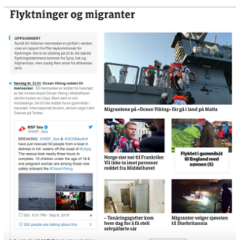
Nyhets saker om migrasjon og flukt per i dag, Aftenposten /NRK